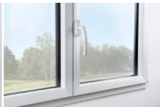
Anta smussata e la sua maniglia