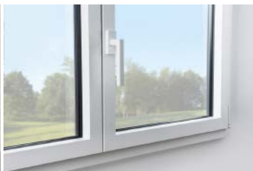
Anta squadrata e la sua maniglia